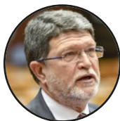
Tonino Picula zastupnik u Europskom parlamentu – Hrvatska