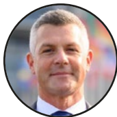
Matjaž Nemec zastupnik u Europskom parlamentu – Slovenija (tbc)