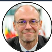
Davor Ivo Stier zastupnik u Europskom parlamentu – Hrvatska