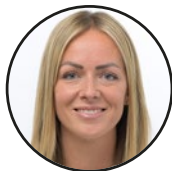
Rachel Blom zastupnica u Europskom parlamentu – Nizozemska (tbc)